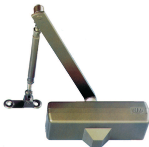
Zavírač MAB 403 2 480,- Kč bez DPH

Rameno s nastavitelnou aretací a tepelnou pojistkou, která samočinně odaretuje dveře při zvýšení okolní teploty nad 70°C. Zavírač s požárním ramenem se montuje na požární dveře, které bývají často otevřeny. V případě požáru se na základě uvolnění tepelné pojistky dveře uzavrou a tím oddělí požár od dalších prostor.