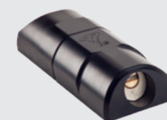
ARMADLOCK zajištění dodávkových vozů a garáží